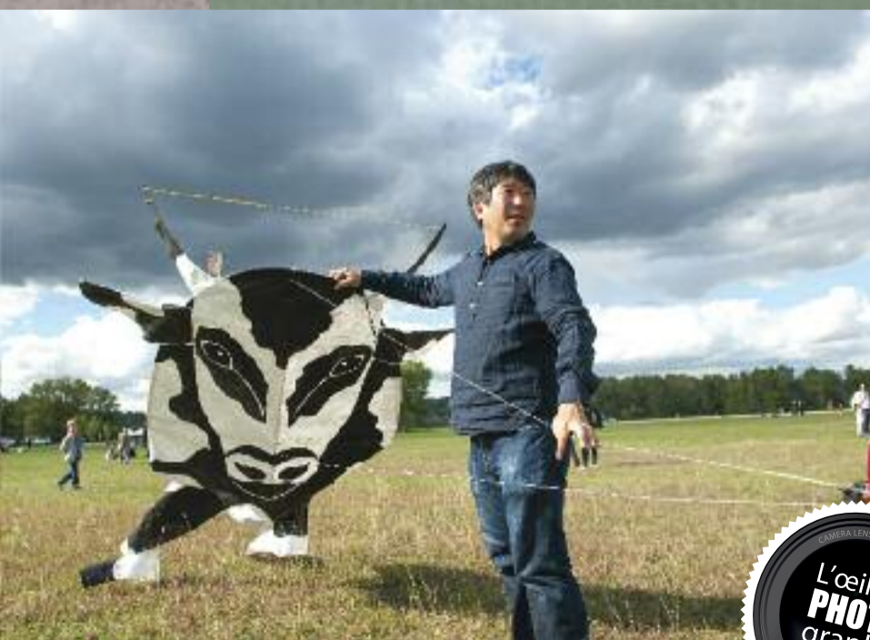
Performance de l'artiste japonais Shimabuku, le 16 septembre au Grand parc dans le cadre de la Biennale d'art contemporain.

La jeune femme connue pour sa plume et son flow quitte la ville afin de poursuivre ses études. Elle prépare une thèse à la faculté de Médecine de Paris dans le domaine de la santé publique.